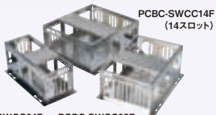
PCBC-SWCC14F (14スロット) PCBC-SWCC04F (4スロット) PCBC-SWCC08F (8スロット)